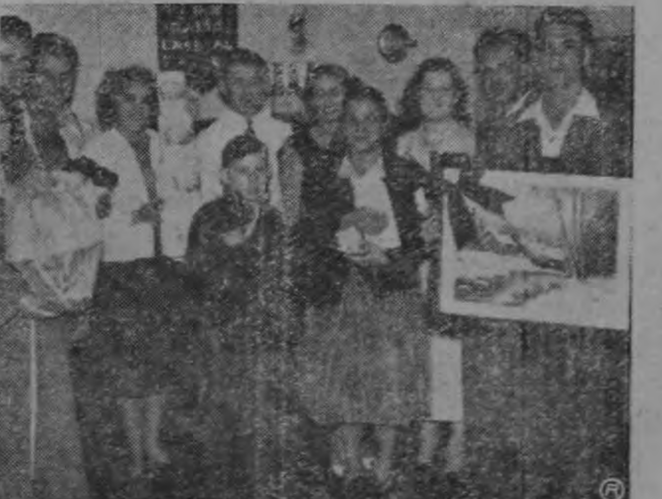
Entrega de premios a las madres en Radio Crystal, con motivo del Día de la Madre.