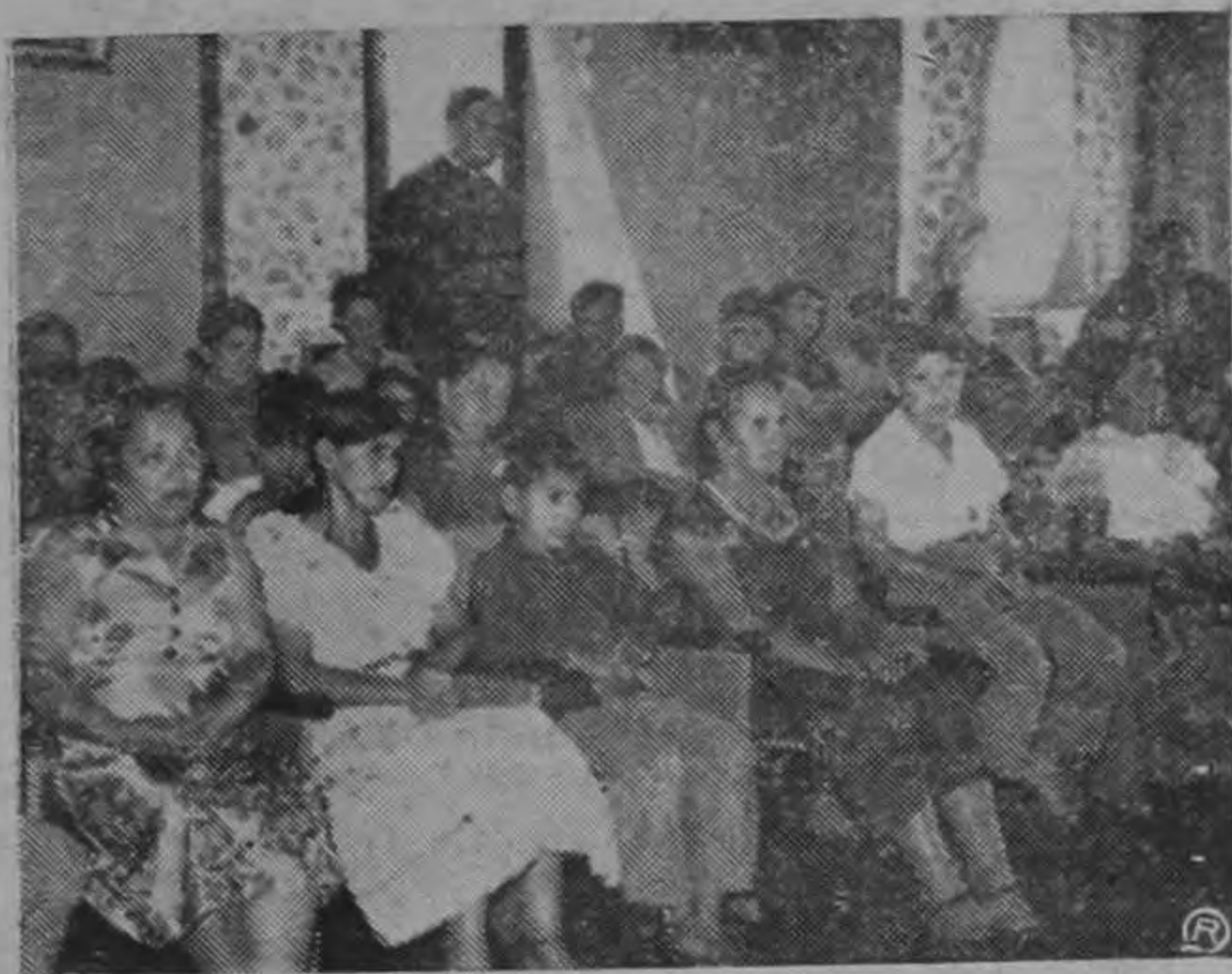
Lustradoras y sus familiares durante la fiesta que se les ofreció el Día de la Madre en el Palacio Arzobispal