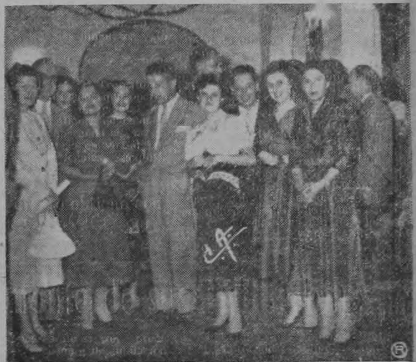
Grupo de bibliotecarios que están participando en el Congreso que se realiza en Turrialba, con la concurrencia de especialistas de 14 países latinoamericanos.

El domingo los delegados fueron agasajados con un paseo al Volcán Irazú y un almuerzo en el Sanatorio Durán.