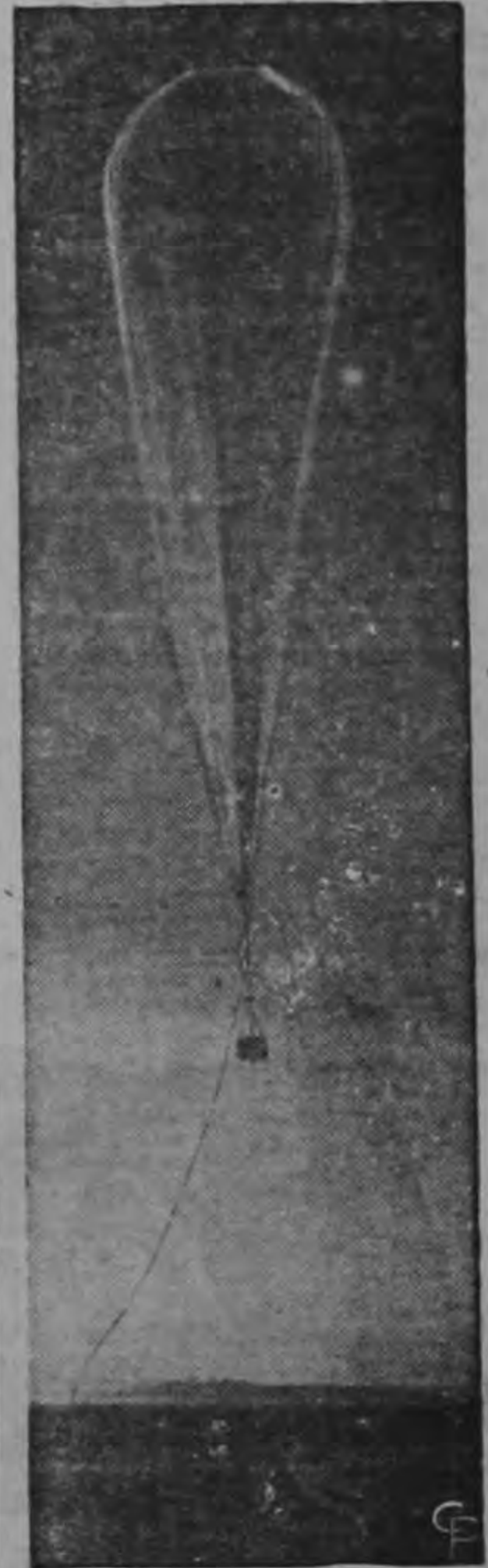
Un globo meteorológico tipo ballena inicia su ascensión en una base de la Fuerza Aérea Americana. Una vez arriba, en el aire, fácilmente puede ser tomado por un "platillo volador".

El Centro de Inteligencia y el Cuerpo de Observadores de Tierra están haciendo una gran labor, pero la gente sigue preguntándose qué serán esas cosas que oficialmente se clasifican como "objetos desconocidos" o como "fenómenos inexplicables".