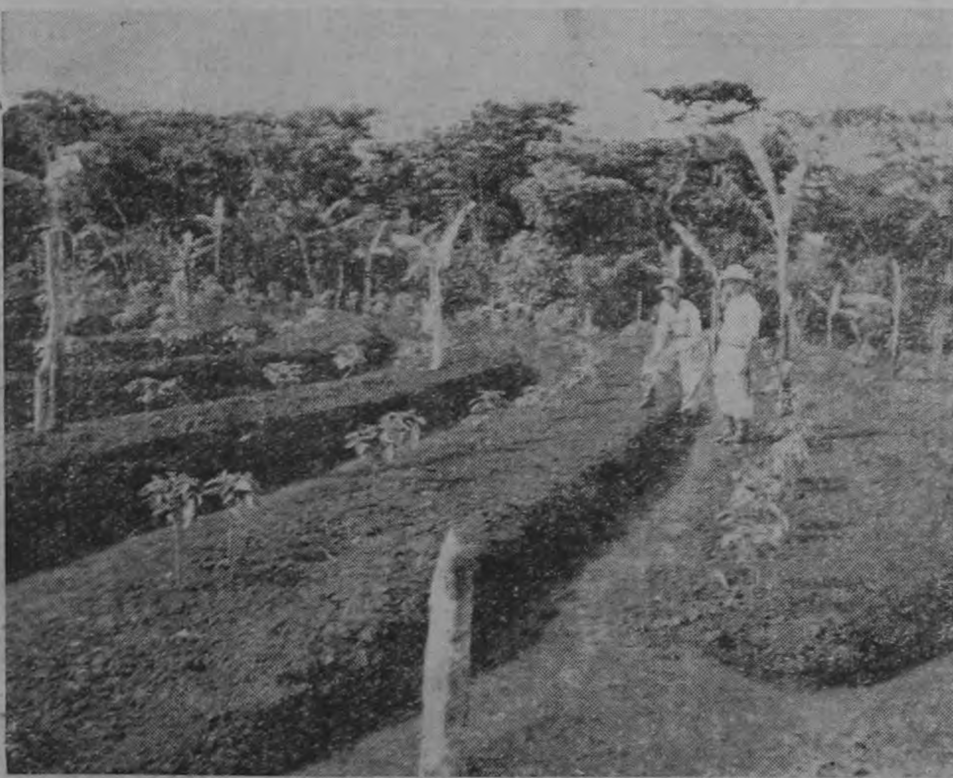
LOS RECURSOS NATURALES.—Al iniciarse la Cuarta Semana de Conservación de los Recursos Naturales, LA REPUBLICA evoca esos valores positivos que son la tierra y el agricultor, fuentes de riqueza y de bienestar para nuestra patria y el pueblo.