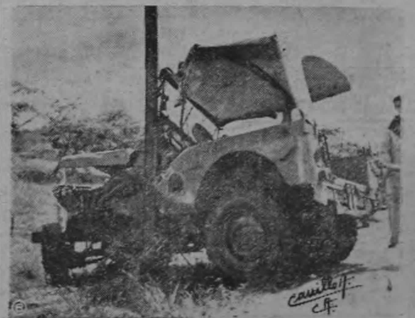
Jeep placas número 300 que se estrelló en la carretera a Cartago resultando varias personas heridas.