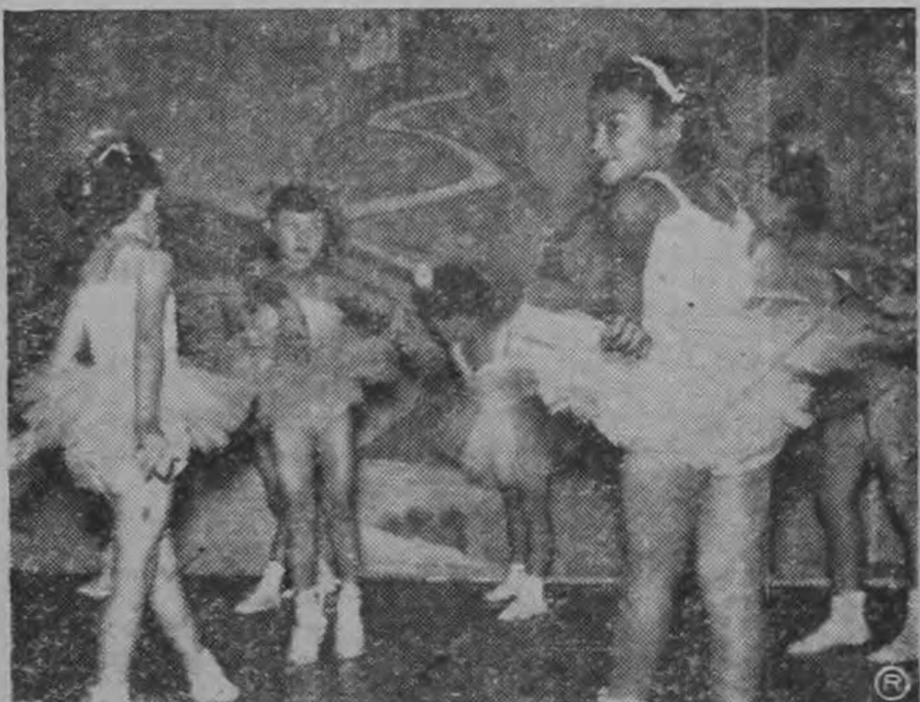
CELEBRACION DEL DIA DE LA MADRE.—Con diversas y significativas actuaciones fué celebrado el Día de la Madre. Las dos primeras fotos corresponden a la fiesta religiosa que se realizó en el Liceo de Costa Rica y al desfile de los alumnos de ese plantel.; en seguida, un aspecto de la función ofrecida en el Kinder Margarita Esquivel, con participación de un precioso conjunto de chiquitas; y al pie, un grupo de pequeños limpiabotas, acompañados de sus familiares, en la fiesta que se les dedicó en el Palacio Arzobispal..

(Declaraciones del Consejo Universitario, en página 3)