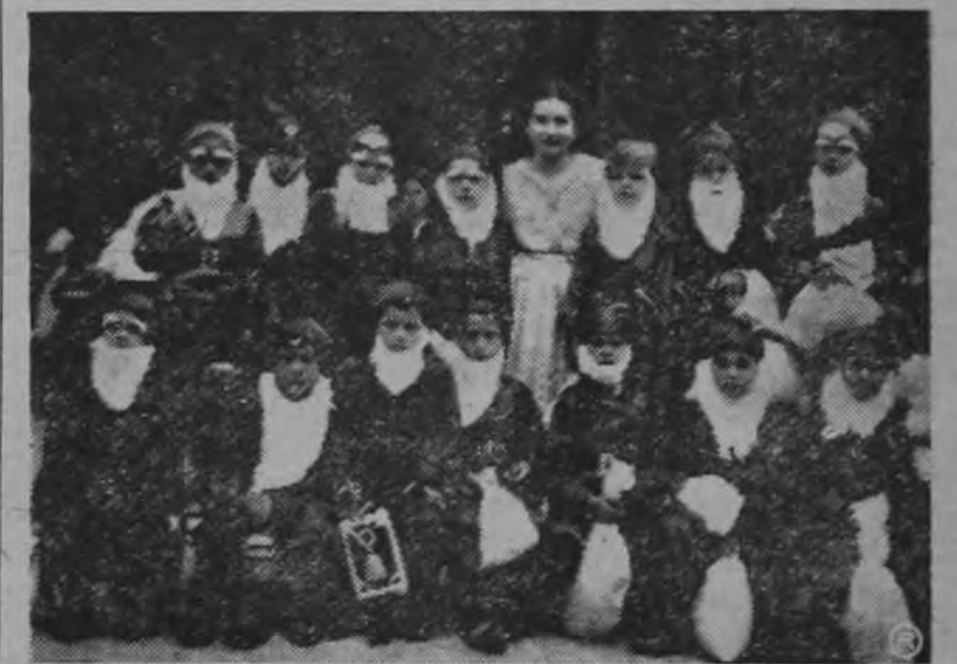
El grupo de los enanitos durante la fiesta que en celebración del Día de la Madre se realizó en la Escuela García Flamenco.

Entre tanto continúan los arrestos ordenados por el primer de oficiales del ejército, funcionarios de la Corte y miembros de la oposición en el majlis (parlamento). El premier ordenó ayer la disolución del Majlis después de referirse a los resultados del plebiscito popular celebrado a principios del presente mes. El gobierno reclamó un mandato del pueblo. El Chah, la única oposición inmediata que restaba a Mossadegh, ha sido por lo menos temporalmente eliminada. De 33 años de edad, y procedente de Teherán, Mohammed Reza Phavlev y su Reina Soraya huyeron a Iraq, donde el gobierno de Bagdad les alojó en el Castillo Blanco. Se espera que el gabinete de Iraq se reúna en breve con el objeto de acordar la política a seguir con respecto al Chah. La ola de arrestos que envolvió a los generales Batman Guelich, ex-Jefe Auxiliar de Estado Mayor y a Cheihani, antiguo Prefecto de la Policía se produjo pocas horas después que el Ministro del Exterior Hussein Fatemi fué hecho preso.